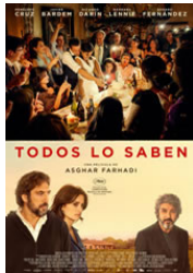
JAVIER BARDEM por TODOS LO SABEN