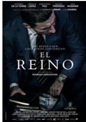
ANTONIO DE LA TORRE por EL REINO

Premio de la Prensa a la Mejor Interpretación Masculina, dotado por la Fundación AISGE